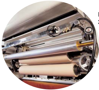
ROTARY TYPE 3 IMPRESSION ROLL

(WOOD GRAIN. TEXTILE. WALL PAPER. FLOOR COVERING)